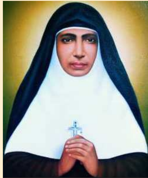
BLESSED MARIAM THERESIA